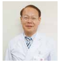
院長 齊藤 雅也

2年間の初期研修生活は ▶ 職業人としての医師 ▶ 組織人としての医師 ▶ 社会人としての医師 これらを目指す皆さんにとって、この上ない機会です。素敵な医師を目指しておられる貴方を、病院職員がこぞって歓迎し、そして惜しみない支援をしてゆきます。